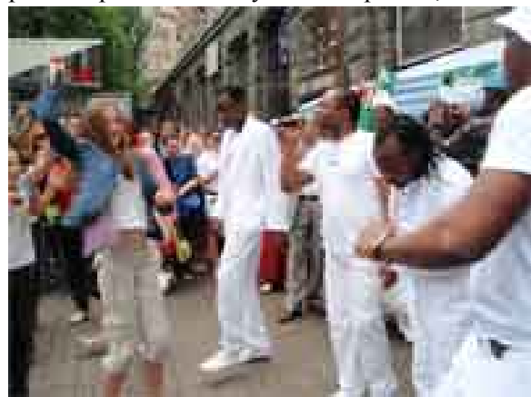
Танцы на Хрещатике в Киеве, 31 мая, 2009 г.

31 мая 2009г., во время празднований Дня Киева, один из уголков главной улицы столицы Хрещатика превратился в платформу яркой энергии и африканского ритма. Все африканские сообщества вместе с людьми с других континентов завершали недельное празднование Дня Африки. Среди тех, кто посетил празднество, были послы Нигерии и Южной Африки в Украине, представители посольств Ливии и США в Украине, Международная организация миграции, Восточно-Европейский институт развития и Инициатива разнообразия. Выступая с речью, посол Нигерии господин