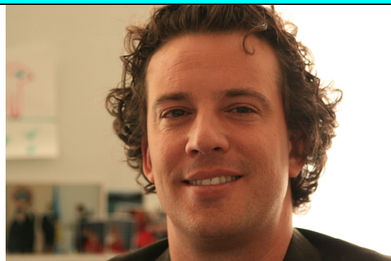
Джеффри Лабовитц, Глава миссии МОМ

Африканский центр, вместе с Инициативой разнообразия, которая объединяет более чем 50 организаций в одну сеть, провел много встреч с представителями всех сообществ по поводу празднования Дня Африки. В этом году, главным лозунгом был «Взаимодействие разнообразий», как сообщил Президент Африканского центра Чарльз Асанте-Ебоа. Глава миссии МОМ, Джеффри Лабовитц, который также является со-председателем Инициативы Разнообразия, придает особое значение этому празднику. В частности, он сказал, «Празднование Дня Африки для меня занимает особое место в списке всех мероприятий, в которых мы принимаем участие. Богатство культуры из Африканского континента, представленное на этом ежегодном празднике делает его запоминающим событием, и создает почву для расширения дружбы и диалога культур.» Среди разных запланированных мероприятий – встреча представителей сообществ 25 мая, футбольный турнир и шоу концерт на Хрещатике на выходные дни – 30-31 мая.