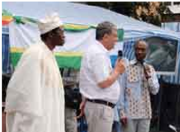
Посол ЮАР Андрис Венгер