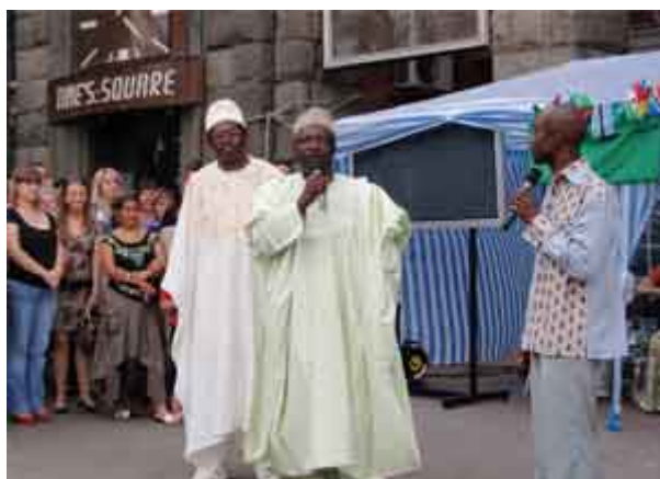
Посол Нигерии Ибрагим пада Касай

подчеркнул необходимость празднования его для всего человечества. Южноафриканский посол Андриес Вентер выразил радость по поводу того, что чувствовал себя как в Африке и затосковал по дому. Он добавил, что в следующем году праздник будет организован с большим размахом, имея в виду предстоящий кубок FIFA-2010. Представитель американского посольства господин Марк Вуд всех